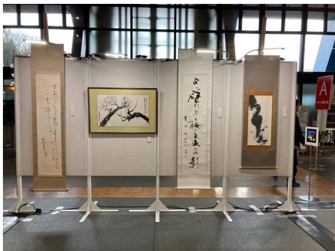
指導教員：賛助作品（左から）