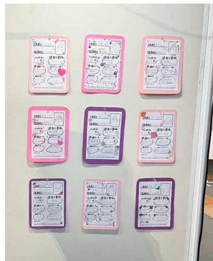
自己紹介コーナー