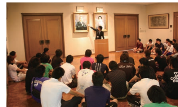
キャリア基礎演習(自校史)の風景。