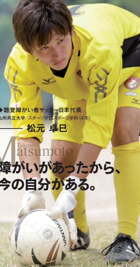
◆聴覚障がい者サッカー日本代表 九州共立大学 スポーツ学部スポーツ学科(4年)