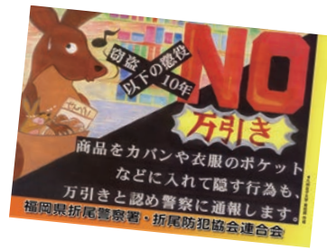
◎ほのほのタッチの万引き防止ポスター お腹の中で泣くカンガルーの子どもが、「万引きはダメ!」と母親に訴える。親しみを感じるキャラクターを用いて、重いテーマを受け入れられやすく表現した。